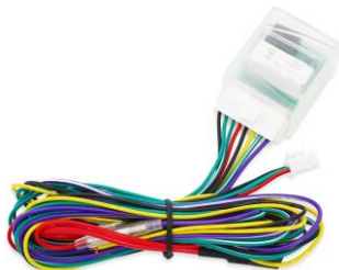
ヒューズホルダー付き ハーネス