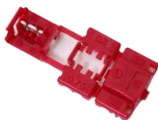
割込コネクタ 1セット